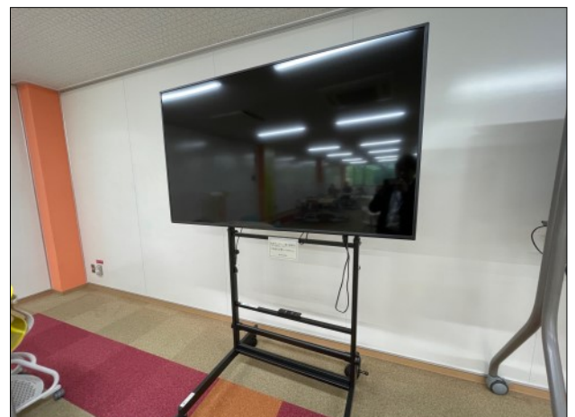
65inch モニター×1 リモコン×1