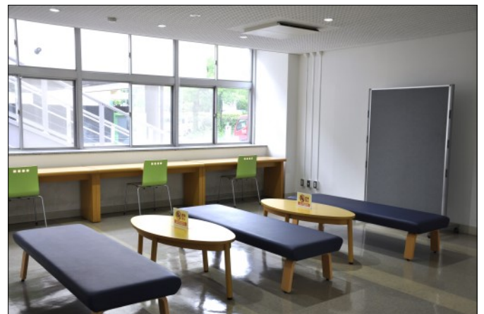
前室（飲み物のみ可）