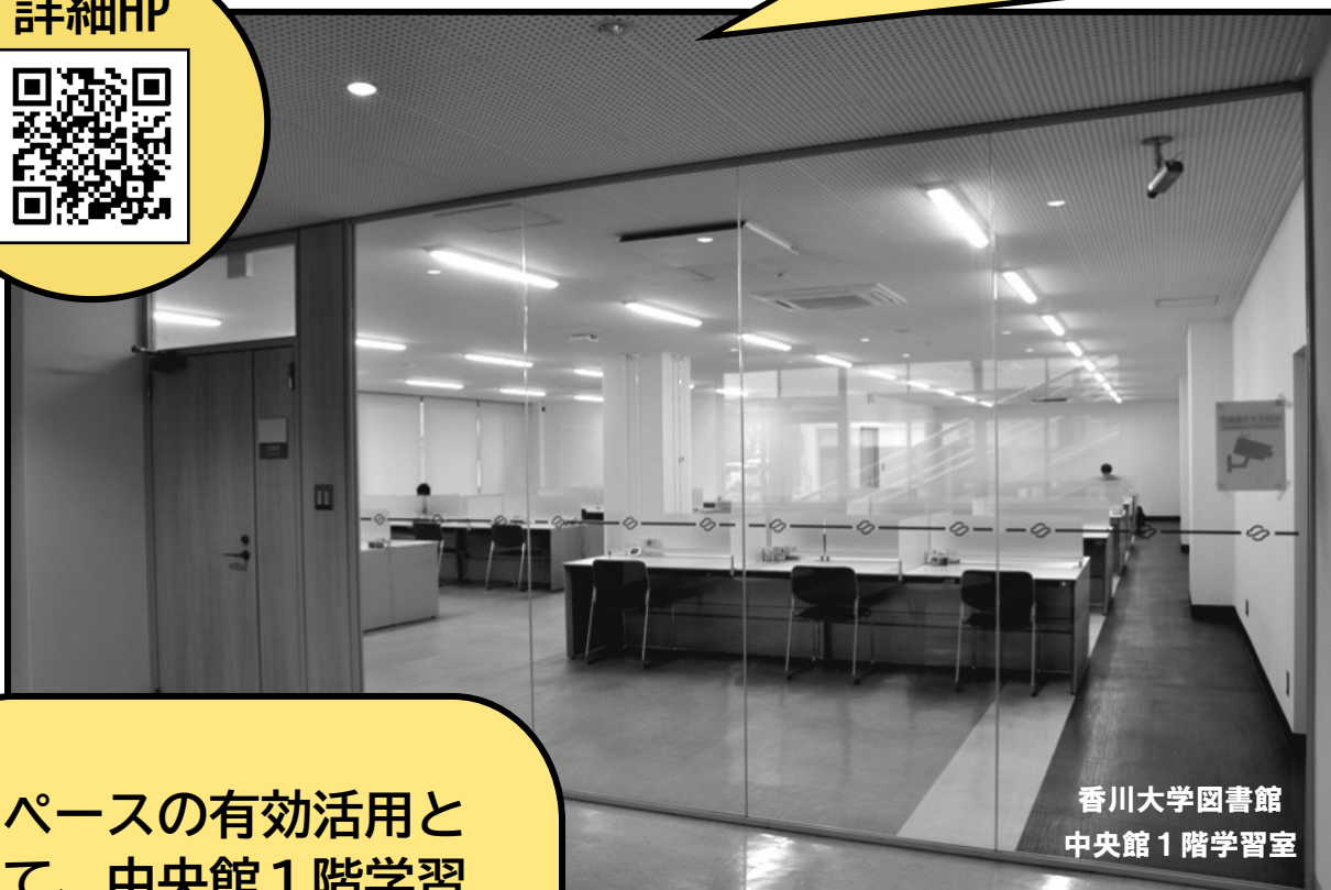
香川大学図書館 中央館1階学習室