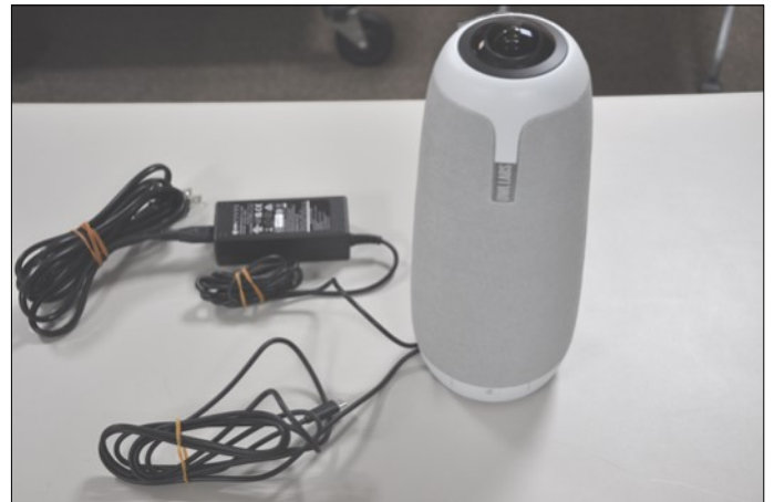
web会議用の360度カメラ ×1 (ミーティング オウル)