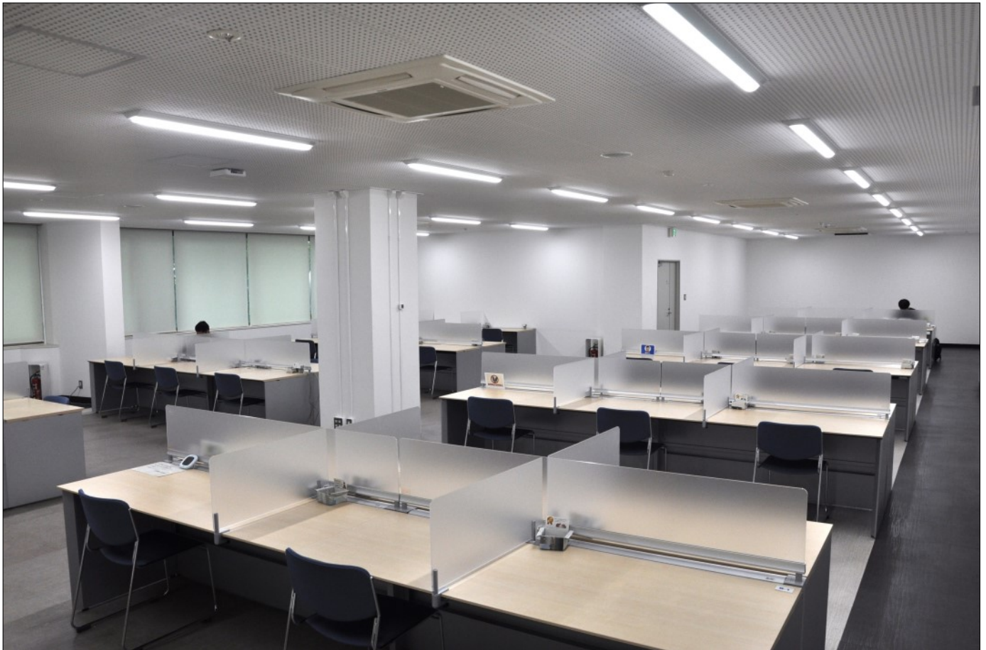
中央館1階学習室 10台 54席

令和6年4月から、学生の利用が減る休業期は、光熱費節約のため閉室することとしましたが、休業期のスペース有効活用を検討するため、今年度は、学内への貸出しを試行します。