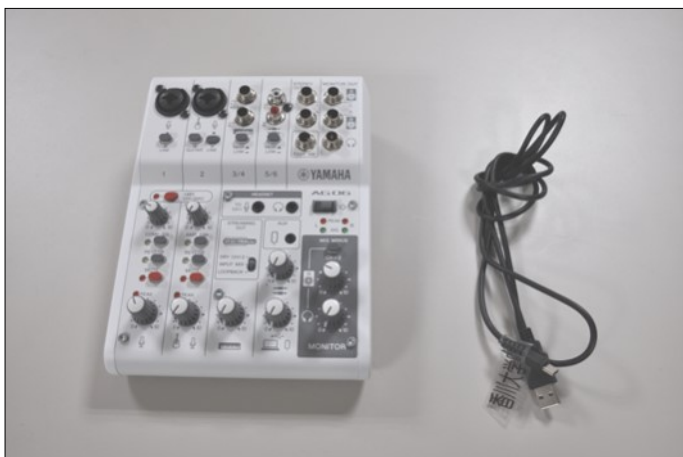
ウェブキャスティングミキサー ×1 専用コード×1 (ヤマハ AG06 MK2)