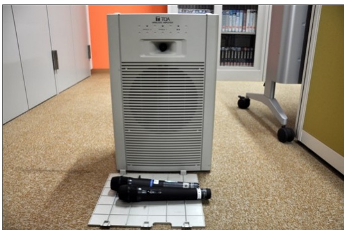
無線マイク&スピーカー マイク2本