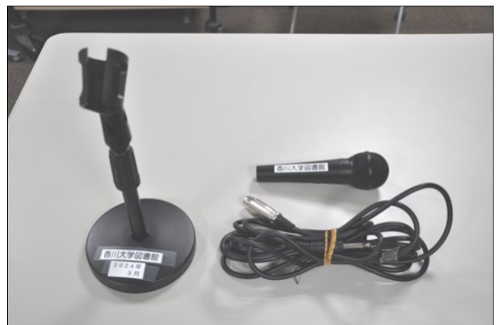
ヤマハ有線マイクDM-105 ×2 マイクコード(5m) ×2 マイクコード(10m) ×1 マイクスタンド ×1