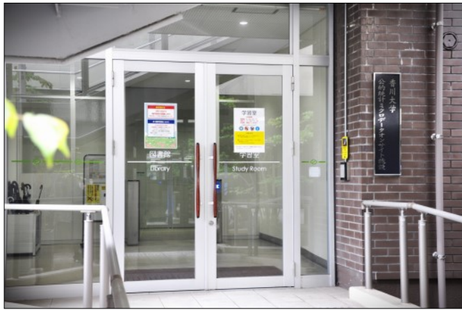
中央館1階入口（学生会館向かい）