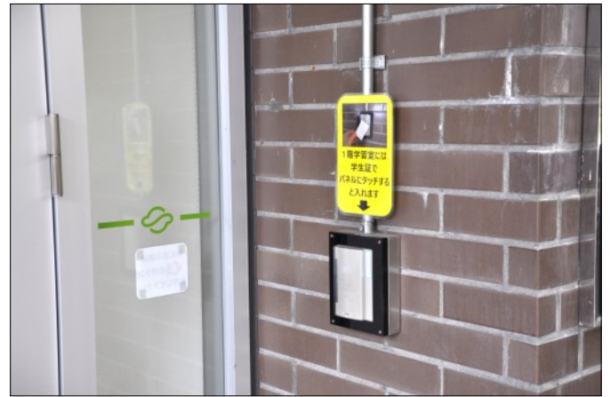
中央館1階入口の認証装置